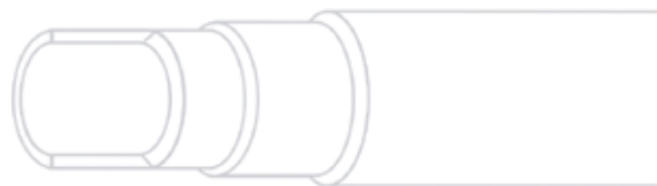
Swepipe DD - golvvärmerör.

I SWEBO Bioenergys golvvärmesystem har vi valt att arbeta med ett golvvärmerör som är av hög kvalitet. Swepipe DD har diffusionsspärr (vatten- och lufttät) i enlighet med ÖNORM B 5157, DIN 4726 samt TGM test nr K 15718/1. Diffusionsspärren är tillverkad av ett speciellt syntetmaterial och ligger i två lager vilket borgar för en hög drifttemperatur på upp till +70°C.