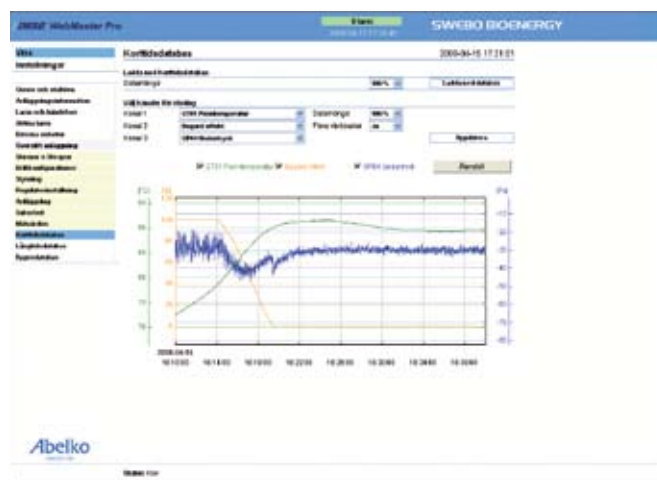
Bild 2 och 3. Ex. på gränssnitt för styrning av anläggning.